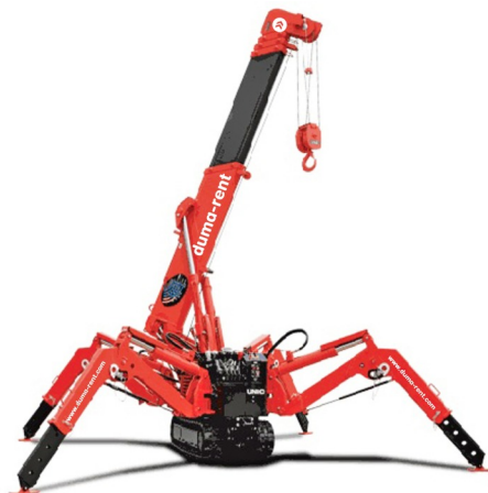
» UNIC URW-295