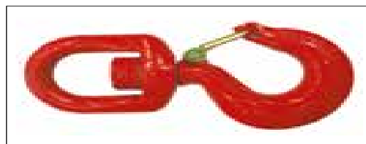
Sécurité : crochet pivotant autobloquant homologué.

* Vitesse de crochet sans charge. ** Sans support.